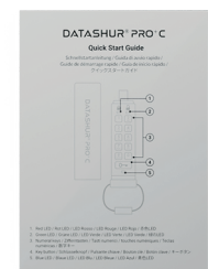
Guide de démarrage rapide